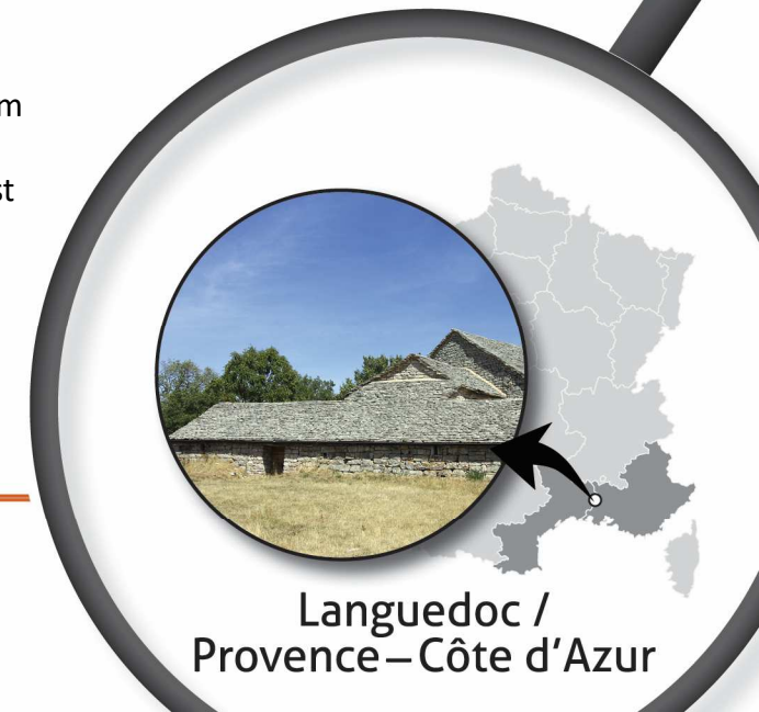
Languedoc / Provence – Côte d'Azur